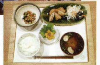
▲栄養バランスのよいランチ

詳しいお問い合わせは・・・ ホワイト歯科クリニック TEL 048-664-6642