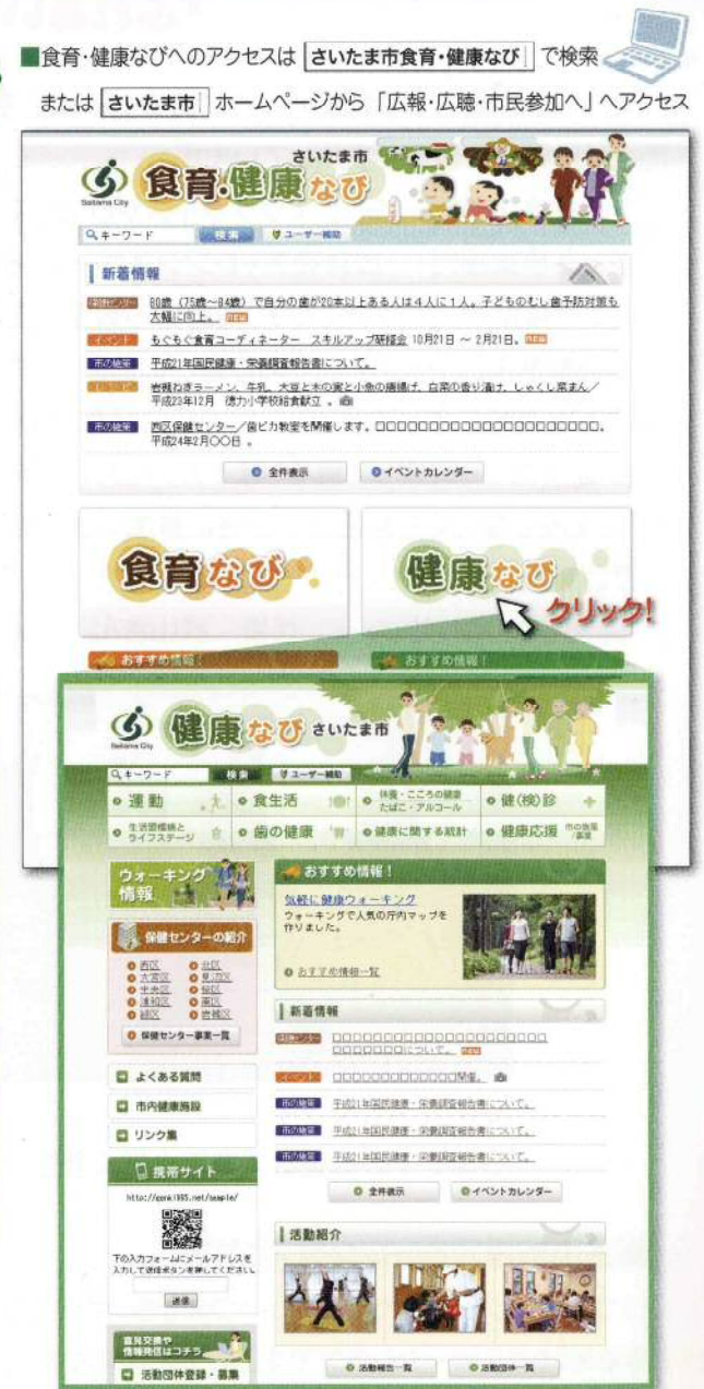
■食育・健康なびへのアクセスは「さいたま市食育・健康なび」で検索または「さいたま市」ホームページから「広報・広聴・市民参加」へアクセス

食育・健康なびの開設にあたり、活動団体の登録(任意)をお願いいたします。活動団体として登録いただきますと、団体の開催するイベント情報や、日々の活動を食育・健康なびより情報発信することができます。活動団体登録については、サイト開設後、随時画面からご登録いただけます。また、サイト開設は市報4月号でご案内します。ぜひ、ご利用いただき、サポーターの皆様方のいきいきとした健康づくりへの取組みをPRしてみませんか。