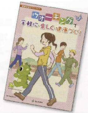
▲平成23年1月発行の健康増進ガイドブックもあわせてご活用ください。